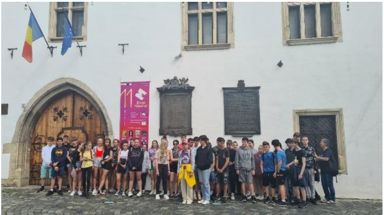
Mátyás király szülőháza előtt.

Megállapítottuk közösen, hogy több napot is el tudnánk tölteni Kolozsváron.