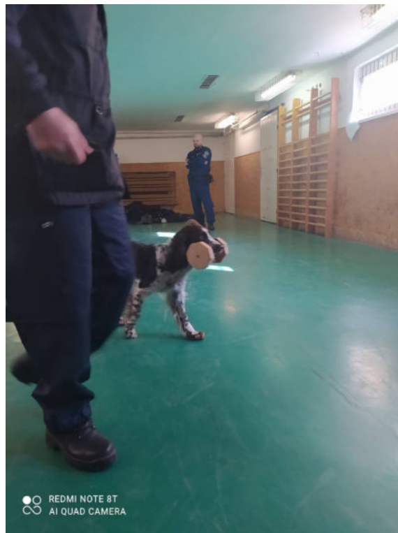
Budapest, 2022. február 19.